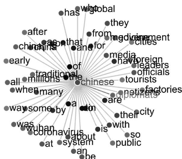
图 5 Chinese 一词搭配网络

文聚焦国家形象建构,按图 5 的搭配网络,回看相关索引行,需剔除与国家形象建构无关的信息,比如中医药 (traditional, medicine) 在抗疫过程中扮演的角色、中国网民 (netizens) 的态度、复工复产 (factories, city/cities)、因防疫措施导致国内外游客 (tourists, foreign) 出行受阻等。因此,下文分别从外交 (diplomats)、媒体 (media) 和政府领导、官员 (officials, leaders) 三方面进行讨论。