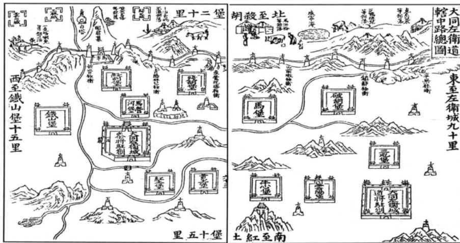
图3 大同左卫道辖中路总图 [3]427-428

大同左卫道辖中路总图(图3)所示大致相符, 但文字记载存在差异。差异因何而生? 一方面, 两者在论述破胡堡、残胡堡、铁山堡地理方位之时, 选取的参照物不同。《宣大山西三镇图说》记载: “破胡堡南至牛心山堡三十里, 西至马堡一十五里, 北至边墙一里, 东至宁虏堡三十里。残胡堡南至黄土堡六十里, 西至杀胡堡三十里, 北至边墙五里, 东至破胡堡三十里。铁山堡南至云石堡二十里, 西至边墙三十里, 北至右卫城二十里, 东至红土堡二十里。” [3]432, 434, 436 另一方面, 在《宣大山西三镇图说》中, 铁山堡于嘉靖三十八年修筑 [3]137 , 杀胡堡于万历二年增修 [3]135 , 而《纪要》记载分别为嘉靖二十八年、万历三年, 时间上与前者有差异。