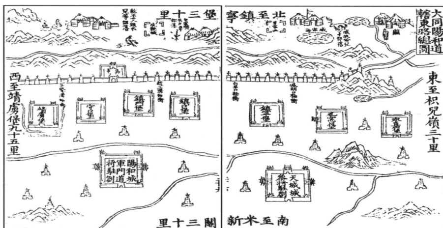
图2 大同阳和道辖东路总图 [3]391-392

通过对比, 可以发现《纪要》所载各堡地理方位与大同阳和道辖东路总图(图2)所示大致相符, 但文字记载略有不同。一方面, 《宣大山西三镇图说》在描述镇口堡、镇宁堡地理方位之时, 与《纪要》选择的参照物不同: “镇口堡南至天城三十五里, 西至镇门堡二十里, 北至本堡边墙一里, 东至镇宁堡一十八里。镇宁堡南至天城二十里, 西至镇口堡十八里, 北至本堡边墙一里, 东至瓦窑口堡二十里。” [3]398-399 另一方面, 《宣大山西三镇图说》对镇门堡设置时间的记载为嘉靖二十五年 [3]119 , 而《纪要》为嘉靖二十六年。