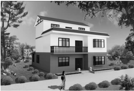
图 3 司背组建筑设计效果图

环境整治:“统筹安排,标本兼治”,综合治理乡村人居环境,将专项治理与长效管理、恢复重建与发展提升、改善环境与提升素质有机结合起来,推动环境综合治理工作走向规范化、常态化。 [9] 作为 4A 级景区的汝城热水温泉景区,其村庄环境卫生还远远不达标。因此,益将村发展乡村旅游必须汲取教训,加强整治,具体包括清理街道垃圾、土堆,新建垃圾池,建造公厕等。