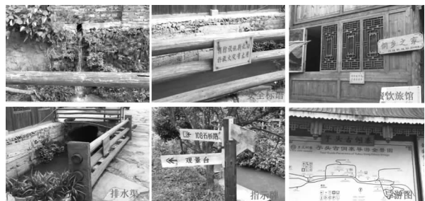
图3 已建旅游服务设施

2. 管理体制。芋头侗寨旅游管理体制是以双江镇政府主导,通道县万佛山侗寨旅游发展有限公司为主体,实行承包开发,旅游公司负责收取门票,联系宣传工作。村民以从事农副产品销售、开旅馆等方式参与旅游开发。但是在景区经营管理方面村民没有参与权、知情权和决定权。由村委会代表村民与旅游公司和政府进行交涉有关事宜。