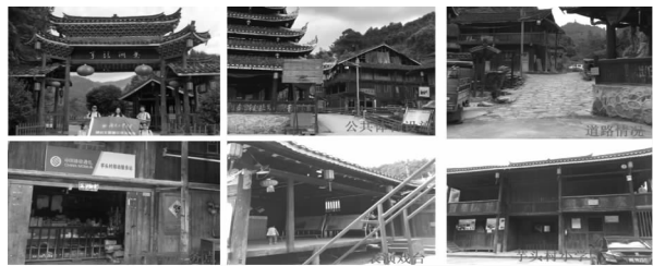
图2 已建公共基础设施

1. 基础设施建设现状。目前为止,芋头村侗寨景区修建了代表侗寨特色的景区山门、售票服务处、道路基本实现了硬化,路况良好,车辆可以抵达村活动中心,但是可供停车场面积较小。剩余游览路线以步行为主,路面均为青石板路。目前已建的村内公共设施如下图所示,已完成的旅游服务设施建设情况如下图所示2所示。