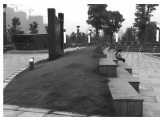
图9 云影广场角落型座椅