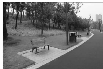
图10 神农城休闲座椅

度不同、人际需求不同,因此神农城在选择座椅时也采用了不同的造型。湖边单体型座椅可减少陌生人的打扰与影响,为单独在公园活动或休息的人群提供相对独立的个人空间;沿路布置的直线型座椅可方便两人间的正面交流与互动,为相伴而行的人群提供足够的共处空间;欢乐谷的弧形座椅(图8)、云影广场的角落型座椅(图9)可适应各种不同社交活动的需要,为团体活动、聚会等提供充分的活动空间,其构成的内聚空间,为人们的交谈也提供方便,同时也使人在心理上形成安全感。