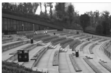
图8 欢乐谷弧形看台