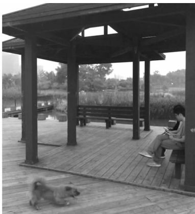
图 11 神农城组合型凉

神农城内部分景点设有组合型凉亭,亭内座椅间呈 90 度成角错位布置,合适的摆放形式不仅利于游人间的自然攀谈,且可以避免陌生人因面对面、眼对眼造成的尴尬,保证个人空间不受侵犯(图 11)。