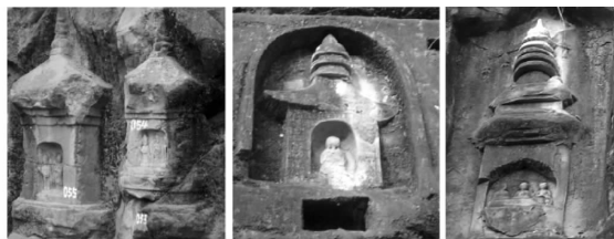
图3 巴中石窟、夹江石窟中的单层塔 [10]

学者们认为此塔就是《严逊记》中所说的“佛会塔”,从佛会之塔的结构样式来看,应属宋代。这种塔在结构上属于单层式塔,也叫亭阁式塔,在四川地区的石窟中常见,多属于唐宋,如图 3。