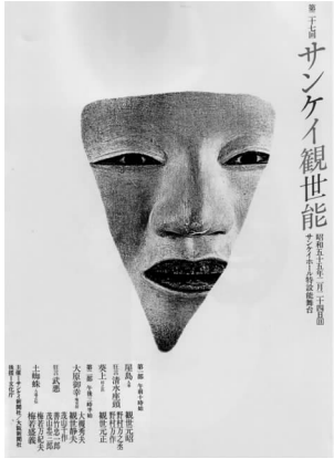
图6 第二十七回产经观世能 1980年

画面中的虚实带给受众的是日本唯美主义的视觉感受。例如:《第二十七回产经观世能》(图6)的主体图形主要由实形构成,但也明显感觉到虚形的存在。画面的主体图形——能面为“大原御幸”的“若女”,由于这位“若女”在舞台上戴着白色的帽子,设计家把帽子部分去掉,最后形成了不完整的面具即画面中的三角形,去掉的帽子形成了白色且和海报的白底自然地融合到了一起,赋予整个画面无限扩展的空间感。正是由于帽子的白(虚)使得能面(实)更加突出。