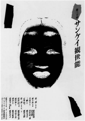
图7 第三十回产经观世能 1983年

在虚实关系的处理上,田中一光不断探索新的视觉形式。例如:《第三十回产经观世能》(图7),作者考虑到表现主题的特殊需要,第一次将能面以黑白反转的形式出现,这次能面的头发、眼睛、鼻子和嘴唇处理成了白色(虚),脸面也就相应地变成了黑色(实),给人一种意料之外的视觉刺激。五官的白色和空白的底面形成了 (下转第130页)