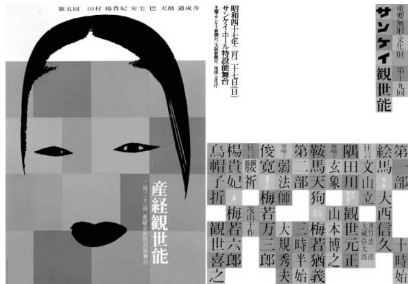
图3 第五回产经观世能 1958年

例如:《第五回产经观世能》(图3)就是这种风格的代表作,田中一光把经过抽象简化后只剩下头发、眼睛和嘴唇的黑色能面安排在面积不完全均等且没有完全对齐的方格骨格构成之上,其方格网大概占据了画面的五分之四,其余部分是一块妙不可言的空白,给人一种想象的空间和通透感。作者通过色彩的中介作用把严谨的方格和自由的能面这一对原本完全不同的造型天衣无缝地结合到了一起。