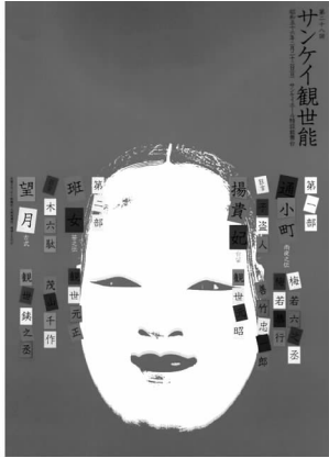
图2 第二十八回产经观世能 1991年

能面的明暗度得到了强化,主次也就更加分明。简化后的能面形象不仅体现了日本传统民族文化特有的精神,而且带有较强的现代意识,传统文化和现代意识在这里得到了完美的交融。