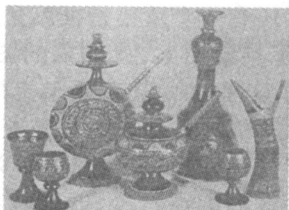
图2 彝族部分漆彩绘酒具 [4]191