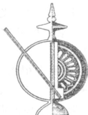
图3 彝族酒壶结构示意图 [1]15

与彝族从古至今一直保持的席地而坐的进食习俗有关。彝族最初是游牧民族,用餐席地而坐,一般无桌凳,餐具放在地上,餐具的造型也与这种生活习惯相适应。高圈足和长柄使进餐者省去弯腰躬背的不便,且圈足使盛器不直接接触地面,饭菜不易变冷。