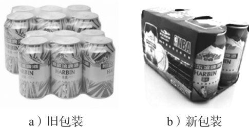
图4 哈尔滨啤酒包装的前后对比 Fig. 4 Comparison of Harbin beer packaging

减量化包装的新思路。“一纸成型”便是一种新型的减量化包装结构,其以纸为材料,通过纸张穿插、折叠等方式作为锁扣结构而成型的一种可便携式包装结构 [8] 。由于“一纸成型”结构简单,可以采用计算机进行辅助设计,从而提高生产效率。目前,“一纸成型”结构已经在多种商品上得到应用,如图4所示,哈尔滨啤酒将原来的不易降解、不便携带的塑料膜简易包装改进为“一纸成型”的结构,不仅绿色环保,而且还增加了装潢宣传效果,使产品美观大方。除此之外,一些食品外卖包装也采用了“一纸成型”结构,如图5所示,“一纸成型”的包装结构,不仅使外卖在打包时更快捷,在配送的过程中能充分地保护食品的完整性,而且“一纸成型”结构所使用的材料能在自然界中完全降解,安全无毒且环保。