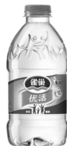
图6 雀巢瓶装饮用水 Fig. 6 Nestle bottled water

薄壁化结构,也是实现减量化包装的重要设计思路。如图6所示,雀巢公司通过改变瓶身结构来增加强度,进而减少瓶身厚度,以达到减量化的包装设计。其瓶身中部采用弓形设计,瓶底采用凹凸结构,瓶身增加横向“肋骨”,以增加瓶身强度,经改进的饮用水瓶质量由原来的14.5 g下降到12.4 g,比旧款包装减少了14.5%,每年大约可节省1450 kg包装原料。