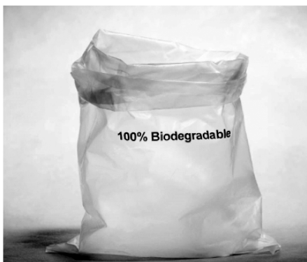
图2 完全生物降解塑料

根据不同产品的性质,其包装材料的选择会有不同的标准,纸制品与木制品并不能满足所有产品的包装要求。可降解塑料是一种既具有高机械强度又可在自然环境中降解的环保型包装材料。目前根据降解原理和降解剂的不同,分为完全生物降解、不完全生物降解、光降解塑料、光/生物降解塑料、水降解塑料等多种类型。其中完全生物降解塑料和水降解塑料因其降解产物不会对环境造成污染,有利于生态环境的优点,而更具有发展潜力,是被认为最具有发展前景的塑料材料。图2为完全生物降解塑料袋。