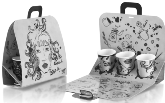
图5 快餐外带包装“一纸成型”结构 Fig. 5 A paper forming structure for fast food packaging