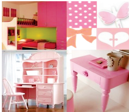
图8 少女粉红系家具

套家具设计的销售点。图8所示的少女粉红系家具以粉红色为背景色,平磨螺钿成蝴蝶结、波点、心型等形状装饰在家具中,新奇可爱的螺钿纹样加上光滑的手感就是这套家具的设计重点。为了增添现代感,也可用天然木质颜色的螺钿,镌钿成拼图、英文字母等纹样装饰在家具中,这种现代化的造型和凸起的质感正符合当下年轻人的审美取向。