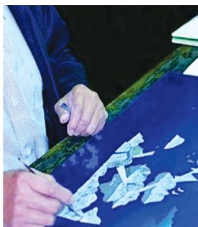
图1 平螺制作 Fig. 1 Flat screw production

以反映中华民族传统文化特征和独特的民族风格为主题的现代中式家具设计,在物质日益丰富的今天,不仅要突出其特定的功能要求,而且要最大限度地展示出设计师的审美情趣,还要满足消费者的审美心理需求。在当代中式螺钿家具制作中,古代螺钿工艺技术中的“平螺”和“点螺”被广泛加以使用。“平螺”即磨平螺钿的意思,就是将螺壳或海贝磨成薄片在家具中加以镶嵌,由于螺片又薄又软,因而又称为“软螺” [4] 。如图1所示为工艺师正在用平螺工艺制作螺钿家具。平螺可大面积应用于家具制作中。“点螺”又称为“嵌螺钿”,该工艺是选用夜光螺、珍珠贝、石决明等材料精制成薄如蝉翼、小如针尖、细若秋毫的螺片,用特制的工具点填在平整光滑的漆胚上,经过精致的髹涂工艺,使产品具有色彩绚丽、随光变幻的艺术效果。如图2所示为工艺师正在用点螺工艺制作螺钿家具 [5] 。