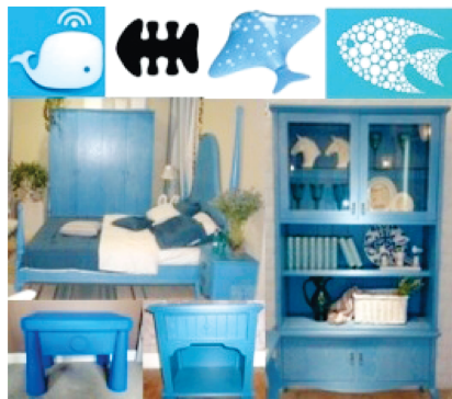
图7 儿童海洋系家具

韩国螺钿家具应用范围很广,装饰纹样多选择现代图案,并与其他材质结合运用,装饰范围覆盖广。如在家具上用格子、卡通等现代图案进行平铺、镂空、拼接等制作工艺,使运用螺钿技术制作的产品精致复古又不乏时尚感。如图7所示的儿童海洋系家具,就借鉴了日韩螺钿家具风格。