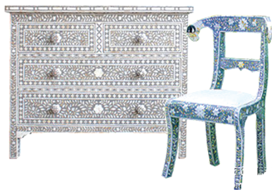
图6 珍珠母贝装饰整理柜及椅子