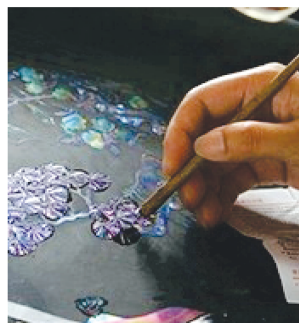
图2 点螺制作 Fig. 2 Spot screw production

如图3所示的平磨螺钿黑底花鸟琴凳,其采用了螺钿与彩绘结合的装饰技法,传承了明清家具的造型,以中式传统图纹和色彩,表现尊贵、喜庆、祥和的主题。螺钿斑斓的色彩与中式家具素雅的色彩,相互之间形成了含蓄柔和的视觉美 [6] 。