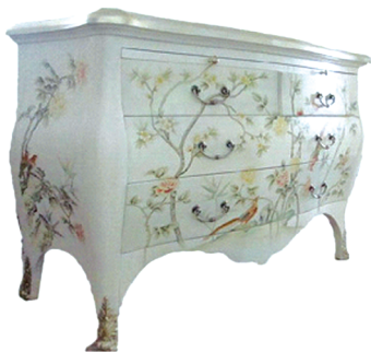
图5 欧式螺钿花鸟玄关装饰柜

如图5所示为欧式实木螺钿花鸟玄关柜,其材料为桦木,样式和颜色都体现出典型的欧式家具风格。该玄关装饰柜的造型有凹凸感,弧线优美,螺钿装饰的图案以花鸟进行点缀,分布巧妙,风格浪漫。其运用雕、镂、镶嵌等技术,采用线条着色、镶嵌花线的装饰手法,创造出一种栩栩如生的花鸟艺术境界。如图6所示为珍珠母贝装饰整理柜及椅子,这款家具的装饰材料为珍珠母贝。珍珠母贝是珍珠生产的直接来源,多用于首饰的装饰。这是目前现代螺钿家具创新应用中非常适用的参考材质,其整体闪亮的视觉效果非常符合现代人对家具的审美要求。该整理柜的图案由手工平螺与点螺相结合的手法制作而成。螺钿部分的色彩搭配得当,纹饰分布均匀,不浮夸,充分展现出现代人们“稳定中求轻巧,简朴中显情趣” [10] 的审美特征。