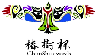
图8 椿树杯北京市社区京剧票友大赛招贴

为了弘扬和传承京剧艺术,北京市举办了“椿树杯”北京市社区京剧票友大赛,大赛设计的宣传海报如图8(图片来源: http://www.zcool.com.cn/work/ZMTQ4NTU2OA==.html )所示。这幅招贴以雄鹰为剪影,将脸谱图案运用其中,雄鹰与脸谱组合,象征京剧艺术如雄鹰展翅飞翔。该招贴设计恰当地运用了雄鹰与脸谱的象征意义,对招贴图案进行抽象化处理,以简单的形式传递出丰富的内涵。