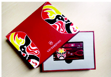
图4 维氏军刀脸谱包装

维氏瑞士军刀中有一款以中国京剧脸谱为设计元素的包装,其如图4所示。瑞士军刀与战斗、勇者等特质相联系,而这些特质不难与中国戏剧中红脸关公的角色联系起来,因此利用红脸关公的戏剧脸谱作为该包装的设计元素成为了首选。该包装盒以明亮的大红色作为底色,盒形上没有过多的装饰,仅以京剧的红脸进行装饰,因而抓住了中国戏剧文化的神韵,给人一种威武霸气之感。