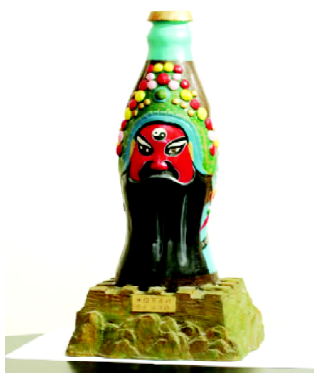
图3 锦绣中华“瓶”我秀 Fig.3 Splendid China “bottle” my show

脸谱艺术运用在包装设计中有它约定俗成的含义。如图3所示为一款名为“锦绣中华‘瓶’我秀”的饮料瓶设计,该作品的设计师将脸谱元素运用在瓶身设计中,使脸谱与瓶子融为一体,瓶身下半部分充当着戏剧人物的胡须。在造型处理上,设计师采用重构、打散、变异、互称和共用等表现形式,将戏剧脸谱这一民族传统艺术与现代造型艺术相结合,从传统出发,运用具有时代感的艺术表现手法,以全新的角度解读民族传统艺术,从而使得这款饮料瓶具有较强的装饰性和设计美感。这款饮料瓶不仅造型精致优美,而且具有历史内涵。