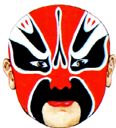
图1 戏剧脸谱 Fig. 1 Drama mask

pic_741255.html) 是我国汉族传统戏曲所独有的化妆造型艺术。脸谱表演最早可追溯到北齐时期产生的歌舞戏剧《兰陵王入阵曲》，此时的脸谱被称之为“代面” [1] 。这种戴面具的表演经过多次更名，到唐代被叫做“傀儡戏”。清朝中期，戏剧脸谱有了很大的发展，逐渐形成稳定的体系，对脸谱细节的勾勒也更为细腻。