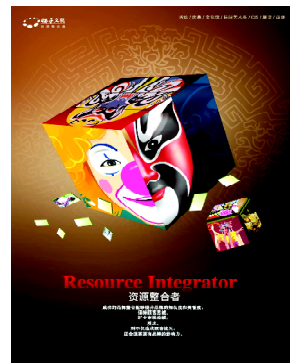
图7 中西脸谱结合魔方 Fig. 7 Integration of Chinese and Western masks in Rubik's cube

近些年来,人们可以在招贴设计中发现中国传统戏剧脸谱元素的身影,其中许多招贴作品不仅能体现设计的中国特色,而且能起到促进设计文化传播与交流的作用。如图7所示的中西脸谱结合魔方招贴设计不愧为成功的招贴设计作品。魔方是一个有着广大群众基础的玩具,其丰富的变数使人在玩的过程中感受到一种创造性的乐趣。该魔方设计把中国脸谱和西方小丑形象重组,既有中国的优秀传统文化,又表现了西方的优秀文化,很好地体现出中