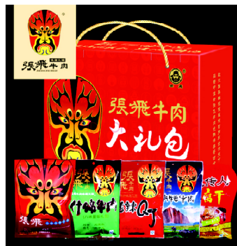
图2 张飞牛肉礼盒包装

戏剧脸谱艺术中的色彩非常美。红脸一般用于表现有血性的人物；黄脸多表现暴戾的人物或者是骁勇善战的武将；黑脸多用来表现公正、铁面无私或者粗鲁莽撞的人；白脸又可分为油白脸和水白脸，水白脸多用来表现诡计多端且地位显赫、善用心计的角色，油白脸表现的多是高傲冷漠、刚愎自用的武夫。在利用戏剧脸谱进行包装设计时，要考虑不同地域使用人群的心理需求，考虑不同人群对色彩的喜好和禁忌。如图2所示为四川著名土特产张飞牛肉的包装设计，该设计利用了戏剧脸谱色彩元素，不仅体现了中国百姓对传统色彩的喜好，而且牛肉经过加工变成肉干后呈现出外黑内红的特点，因而用张飞脸谱红黑相间的色彩来表现，非常形象生动 [4] 。