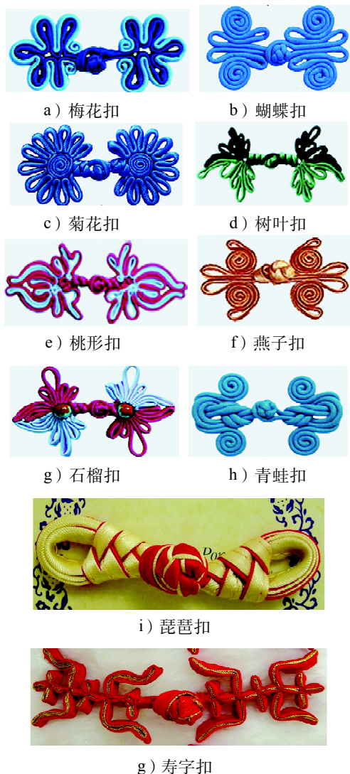
图2 海派旗袍部分盘扣类型

感的开衩外, 盘扣可以说是海派旗袍上的点睛之笔, 图2所示为海派旗袍部分盘扣类型。