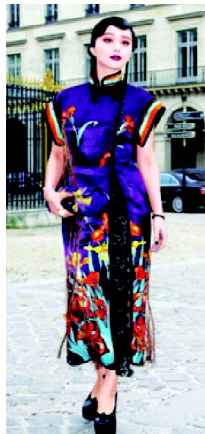
图4 “LV”品牌设计作品 Fig. 4 “LV” design work

随着中国经济的发展及影响力的增强,中国文化也日渐得到外国设计师的喜爱。而中国消费者巨大的消费能力正在受到全世界的关注和重视,顺应中国消费者的文化心理与消费习惯也就成为了一种趋势 [6] 。在服装设计界,有许多外国设计师对中国旗袍元素表现出了极大的热情,他们对旗袍元素的运用往往超乎中国人的想象:他们会在服装中大量且