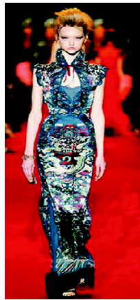
图5 伊夫·圣罗兰设计作品 Fig. 5 Yves Saint Laurent design work

如图5所示的龙纹绣花礼服为世界著名服装设计大师伊夫·圣罗兰所设计。在2004—2005年YSL(Yves Saint Laurent,法国服装品牌,由伊夫·圣罗兰先生与皮埃尔·贝尔热创建)秋冬发布会上,这款蓝青色加上龙纹绣花的礼服惊艳全场。这款礼服在整个设计中运用了海派旗袍的构成元素:在面料上采用了中国的传统锦缎,运用刺绣工艺勾勒出华丽的龙纹图案,显得极度张扬而又大方得体;