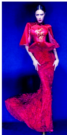
图6 东北虎品牌设计作品

5872a34349b033bba17)所示为“东北虎”高端定制的华服,从整体来看,这件作品是中西方两种不同艺术风格相结合的产物,这是在两种不同艺术风格强烈且直接碰撞下产生的一种新的艺术设计风格,它是现代服装民族多元化设计最直接的体现。在颜色上,该礼服采用了中国红与金黄色的搭配,给人以高贵而刺激的视觉感受,同时又透露着中国传统的贵族气息。上半身的设计为海派旗袍的原始造型,以中国传统的高贵丝绸面料打造出立体优美的廓形,其高耸优雅的立领与复古大方的倒大袖,再加上传统的刺绣图案与滚边作为装饰,使得整个上半身的设计都充满着浓郁的“中国味”,展现出了东方女性的独特韵味;而从腰间往下,该礼服则显得非常地西式与现代化,它采用了鳞片蕾丝作为面料,其鱼尾裙摆设计既能显示出女性双腿的修长,又能透露出极度的性感。这一上中下西、传统而现代的设计造型看似矛盾,却打破了时间与空间的限制,将中西元素完美地融合为一体,呈现出了一种独具风格的时尚美。中西融合的结果使服饰既符合现代潮流,又能够突出中华民族传统服饰文化特色,因而能够达到良好的设计效果 [9] 。