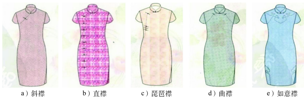
图3 海派旗袍常见的胸襟形式

中国袍服从商、周时期开始就习惯使用开襟的形式, 而且大多为右衽。起初, 旗袍的胸襟是一条开在前胸右边的硬朗折线, 后来逐渐圆顺, 变成了弧线。到了20世纪20年代末, 旗袍廓形开始向合体贴身的形式发展, 旗袍胸襟也开始随着旗袍款式以及旗袍穿着者的身材而进行设计。如对于身材丰满者, 一般采用直襟设计, 开襟的转角处设计成钝角直通旗袍下摆, 这样在视觉上能使穿着者的身材显得较为修长, 而且具有较强的装饰性。而身材瘦小者穿着的旗袍, 开襟一般采用如意襟。如意襟是把“如意”通过镶滚的方式装点在前胸上, 这样能够使穿着者平直的身板上多一些点缀从而增添女性的韵味。海派旗袍的胸襟设计对传统袍服的形式进行了改进, 采用多元化设计, 方圆并用, 单双齐下, 直斜交错, 长短随意, 成为现代服装设计中更新款式时的重要设计元素 [5] 。图3 [2]33-37 所示为海派旗袍几种常见的胸襟形式。