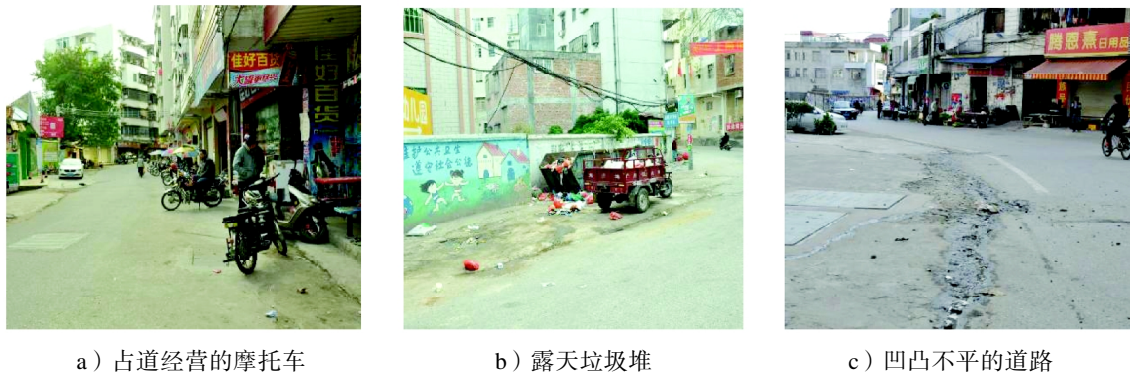
图1 西门岗街道现状