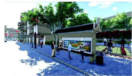
b) 交通指示系统和公交站台系统