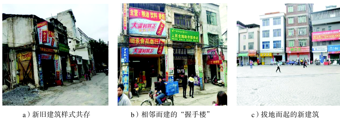
图2 西门岗街道建筑现状

为主,砖木结构的建筑多为有一定历史的民居,除部分保留完整外,绝大多数较为破旧 [5] ;另一方面,部分砖混结构的建筑为解放后新建,这些新建建筑则以钢筋混凝土结构居多。