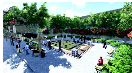
a) 古色古香的休闲小广场

合理完备的街区空间改造,不仅要求人们处理好街区保护与发展的关系,修缮街区的历史建筑,消除安全隐患,而且还要求人们合理调整街区功能,完善街区的基础设施,强化其文化职能,防止街区建设片面追求经济发展。图5所示是本课题组设计的西门岗街道改造整体规划方案的另一个组成部分。该部分设计体现了当今世界城市发展的潮流:提升街区的生态环保等级,打造宜居的人居环境。