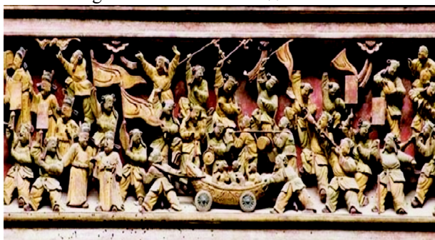
图3 木雕“百子闹元宵”

皖南古村落民居建筑装饰别具一格,细节处理仔细。其民居建筑上有精致的雕刻手工艺,其房屋的门罩、花园、漏窗、梁枋、斗拱、天花、地面、隔扇、墙壁、屏风等方面的装饰细节都是通过工匠们的精心雕琢而成。在民居“三雕”装饰中,木雕的纹案最为常见,有动物、花卉、树木、八宝博古、云头、回纹等纹样 [6] 。宏村的承志堂由于气势恢宏、“三雕”工艺精细及富丽堂皇,故被誉为“民间的故宫”。特别是其正厅的横梁、斗拱、花门、窗棂上的木刻,层次繁复,人物形象众多,人不同面,面不同神,堪称徽派“三雕”艺术中的木雕精品 [7] 。图3所示为承志堂里的雕梁木雕“百子闹元宵”。