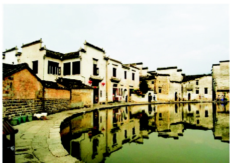
图8 皖南古村落民居的装饰色彩

皖南古村落民居建筑的外观呈现的是黑瓦、白壁、黑墙边。如图8所示, 皖南古村落建筑墙面选用白灰粉刷, 墙头一律为青瓦翘脊, 马头山墙千变万化, 高低起伏, 极富动感和韵律。其室内的天井院四面如图6所示, 都是选取最天然的木装饰, 如梁、坊、裙板、窗栏板等都以木雕来装饰, 这样可以增添室内的美感。同时, 还有落地格扇、高槛格扇、栏杆、栏板, 这些构件全部选用木材, 并保持了木质纹理和其天然色泽, 都不施漆。