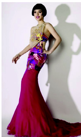
图4 丹凤朝阳礼服 Fig. 4 Dress of “Red Phoenix in Morning Sun”

褶裥裙装从古代至现代都广为流传,在唐朝以前只有单一的筒状款式裙装,而在现代女性服饰设计中,褶裥的应用非常广泛。在设计中,褶裥的应用往往忽视女性的曲线美,在造型上体现出一种和谐、大气的感觉。褶裥裙能够有效地增加裙子的款式造型,从而满足不同的女性对裙装设计的要求。根据设计位置的不同,可将褶裥分为碎褶裥和有规则的褶裥。在应用褶裥的过程中,可以根据裙子的设计造型,改变褶裥的多少和大小,来达到裙子的造型效果。如范冰冰在参加柏林电影节时所穿着的“丹凤朝阳”礼服(如图4所示,图片来源: http://www.yoka.com/club/stylist/2013/0521803692.shtml ),该设计讲究意境与涵义,属于典型的中式设计思维,而在裁剪方法上却采用了全西式的立体裁剪。传统的中式衣服是平面的,刺绣虽有褶皱堆挡却没有拼接断片。该款礼服与传统的中式设计有所不同,在设计中,设计师注重了对人体曲线的表现,将褶皱放到了裙裾部位,这显然是借