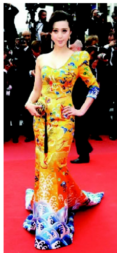
图5 东方祥云礼服 Fig. 5 Dress of “Oriental Auspicious Clouds”

无领顾名思义就是没有领子。如图1~2所示,唐代女性服饰大多为无领低胸,现代服装设计师在服饰设计中巧妙地应用无领抹胸的款式,凸显出女性的性感。因为无领设计使女性胸部以上的部位全部裸露,能把人们的视线转移到脖子及性感的肩部。这种设计不仅能完美地展现女性的肩背线条,还能让性感与优雅完美呈现,却不会因为胸部过分暴露而显得低俗。图5所示为2010年在法国举办的第63届嘎纳电影节上范冰冰穿着的“东方祥云”龙袍礼服。该龙袍礼服采用的无领设计正是借鉴了唐代女性服饰的特点,唐代女性常选择领口很低的服饰,以有效拉长女性颈处的线条,使脖颈显得更加修长,给人一种高贵大方的感觉 [7] 。