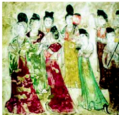
图1 永泰公主墓壁画

唐代初期的衣衫为窄袖,较紧身,可概括为“窄袖衫襦”。如图1所示为陕西乾县出土的永泰公主墓壁画,由该壁画及其石刻画可知,初唐时期的侍女皆梳高髻,穿襦裙及半臂、圆领小袖长衣或翻领小袖上衣,佩蹀躞带,悬承露囊,着小口裤、尖头履,这些都是初唐宫廷贵族妇女着装的典范 [3] 。