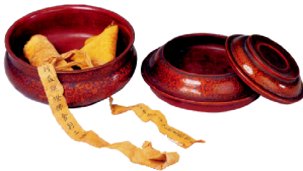
图9 红漆描金缠枝莲花双层舍利盒

藏族宗教物包装的发展是一个不断融汇藏族本土文化、吸收外来艺术营养的过程, 因此呈现出各种艺术风格。从最初藏族的原始崇拜艺术风格、汇入周边尼泊尔等地的古代艺术风格, 到明清时期传入的中原艺术风格, 无不体现出藏族宗教物包装强大的融会贯通、兼容并蓄的能力。如图9所示的红漆描金缠枝莲花双层舍利盒, 此为乾隆年间八世达赖喇嘛进贡给乾隆皇帝的贡品。在舍利盒的选材上, 采用了汉地颇为常见的木材, 并髹以红漆, 饰以汉地常见的缠枝莲花。这款包装无论是选材、造型还是装饰色彩, 都具有十分明显的清廷包装风格。藏族宗教物包装这种对外来艺术的消化与吸收过程, 体现了其强大的融合性, 为其注入了源源不断的生机与活力, 使其具有旺盛的生命力。