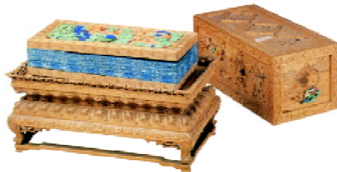
图2 《无量寿佛经》莲座盖包装盒

经书包装主要是根据内装经书的尺寸大小来制造相应比例的经盒,经盒下方多配有工艺精美的四方形底座,以将经盒撑起。如清代的嵌石檀香木《无量寿佛经》莲座盖包装盒(见图2),其经盒即为做工精致的木盒,木盒底部为须弥式,下承托泥,上为束腰浮雕莲座,莲座起檐,盒盖正好固定其中。这一经书包装造型端庄、精美,且其雕刻技术也代表了这一时期的较高水平。