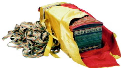
图3 《白伞盖仪轨经》包装

此外,还有一些经书的包装采用了函套的形式,同样具有保护内装经书,方便经书整理、搬运和堆码的功能。值得一提的是,还有一种较为特殊的经书包装形态,为清乾隆时期的《白伞盖仪轨经》锦缎包装(见图3)。此经书包装上下各用一块精雕细绘的木质护经板夹住经文,另以锦缎包裹,外缠五色绦带,并在绦带一端安置鎏金铜环扣,用以束紧、保护内装经文。这种经书包装形式是清宫佛典的经典包装方式。