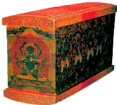
图8 《各佛施食好事经》经盒

在选材和制作工艺方面, 藏族宗教物包装具有不同于其他包装类型的艺术特征: 其用材十分珍贵, 大多以金、银和名贵木材为主, 辅以大量五颜六色的珍贵珠宝, 如玉石、珊瑚、松石、青金石等, 不惜工本, 极显精美华贵; 在包装工艺和装饰技法上也极尽工匠之所能, 将雕刻、镂空、鎏金等工艺运用得炉火纯青, 代表了当时藏族工艺技法的最高水准。如图8所示的《各佛施食好事经》经盒, 该经书包装盒为明成化年间所制, 以象牙作为护经封板, 用高浮雕手法雕刻密宗主尊像, 刀法精细入微, 形态生动, 四周镶嵌红蓝宝石共48颗, 用材极尽奢华, 装饰手法精细异常, 是藏族宗教物包装中不可多见的珍品。