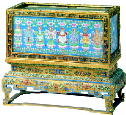
图7 《文殊赞佛法身礼经》经盒