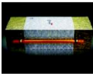
图1 论道茶包装 Fig.1 Packaging of Lundao tea

香港著名设计师陈幼坚先生十分钟爱中国传统文化元素,并以传统的书法文字作为他设计的基本元素。图1和2为他所设计的2款茶叶包装,图片来源:图1来源于中国平面设计网,图2来源于 http://image.so.com/i?src=imageonebox&q=%E7%99%BE%E8%A1%B2%E6%9C%AC%2C%E7%BB%8F%E5%85%B8%E8%8C%B6%E5%8F%B6%E5%8C%85%E8%A3%85%E8%AE%BE%E8%AE%A1%E6%AC%A3%E8%B5%8F 。