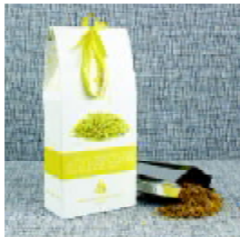
图6 花茶包装 Fig. 5 Packaging of scented tea