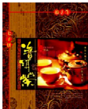
图9 普洱茶包装 Fig. 9 Packaging of Puer tea

在包装设计中,应当充分注重色彩的运用,因为色彩运用恰当不仅能够传达商品的属性,而且能够抓住顾客的情感 [6] 。如图9所示为一款普洱茶包装,其以棕色为背景,以优质的茶汤色泽——宝石红为主色调,给人一种坚实稳重的心理感受,同时体现了该款普洱茶优良的品质。