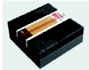
图8 黑茶包装 Fig. 8 Packaging of dark green tea

在包装设计中,应当充分注重色彩的运用,因为色彩运用恰当不仅能够传达商品的属性,而且能够抓住顾客的情感 [6] 。如图9所示为一款普洱茶包装,其以棕色为背景,以优质的茶汤色泽——宝石红为主色调,给人一种坚实稳重的心理感受,同时体现了该款普洱茶优良的品质。