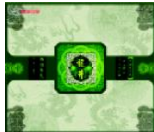
图4 龙井茶包装设计 Fig.4 Packaging of Longjing tea