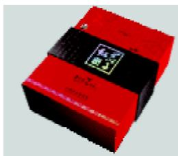
图7 红茶包装 Fig. 7 Packaging of black tea