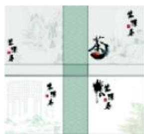
图3 碧螺春包装设计 Fig.3 Packaging of Dongting Pilochum

“半壁山房待明月,一盏清茗酬知音”“拣茶为款同心友,筑室因藏善本书”“舌底朝朝茶味,眼前处处诗题”这些诗句表明,自古以来,茶与文人雅士有着不解之缘,在氤氲的暖气香飘中,好诗可信手拈来。在茶包装设计中,提取国画元素,能或多或少地与国人心中茶文化情结相牵连,从而激起他们的购买欲望。图3(图片来源:昵图网)所示为一款碧螺春包装设计,画面绘上传统的山水纹样,层峦叠翠,烟波浩渺,并配以题诗、印章,有如展开了一幅气韵生动、意蕴悠长的中国古画。龙纹是中华民族神圣、吉祥的纹饰,在一款龙井茶包装设计中,就是以腾龙作为底纹,如图4所示(图片来源: http://so.zhituad.com/?t=0&kw=%E8%8C%B6%E5%8C%85%E8%A3%85&page=3 )。