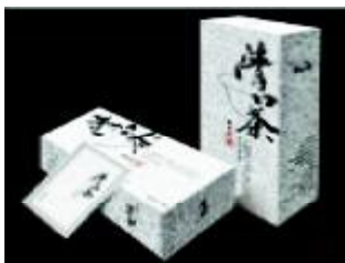
图2 清口茶包装 Fig.2 Packaging of Qingkou tea

图1所示的论道茶包装,没有浮华的外观,仅仅以文字作为产品包装的主要装饰元素,采用老子的道德经作为主要内容,使老子哲学中提倡的“道”与茶道联系起来,具有浓厚的文化意境,同时书法字体流畅洒脱、和谐匀称。如图2所示的清口茶包装设计则主要突出“清口茶”3个字,这3个书法文字在素淡的底子上连绵回绕,节奏的轻重缓急及墨色的浓淡等显得极为相宜,创造出了意动神飞的意境,充分体现了东方传统美学观的三大取向:无饰、饰不夺天然以及天然美。将书法文字应用在现代包装设