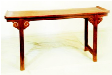
图7 红木家具茱萸纹装饰

意纹样结合在一起应用于家具的装饰设计中。在明清时期的红木家具上,大多有茱萸纹与云纹装饰的应用,如图7所示。