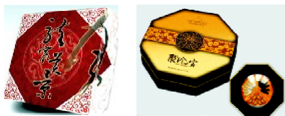
a) 红色为主的包装 b) 黄色为主的包装

html)。红色象征着太阳、火焰、血液等与生命具有较强关系的形象,这种热烈的颜色在月饼包装中运用得比较多。黄色是我国封建帝王的专用色,标志着神圣、庄严、权威。月饼包装运用这两种颜色不仅浓厚了节日气氛,使得整体包装色调协调并透露出华丽富贵之感,在一定程度上提高了产品的档次。包装图案方面主要以茱萸纹为装饰纹样,同时融入了其它传统纹样进行点缀。茱萸纹等传统纹样在食品包装中的应用,深化了产品的文化内涵,表达了产品独特的意蕴。