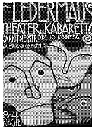
图5 弗勒德茅斯咖啡馆广告 Fig. 5 Advertising of Fledermaus Café

非常成功。从立意来看,非常传神地表现了“弗勒德茅斯”咖啡馆是一个不寻常的、能够给人带来惊喜的地方。这里是一个舞台(既是表演者的舞台,也是观赏者的舞台)。在这里,人们可以避开现实的纷扰,带上面具,释放自己。