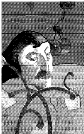
图3 《带光环的自画像》

《带光环的自画像》(如图3所示)为高更的自画像,背景的大块红色,既象征炼狱,也象征天堂。前景的大面积橙色,象征着高更认为自己如基督一般的神圣,具有救赎的力量。在自己笔下,高更俨然成了一位正在沉思的神。画中的色彩不是叙事性的,而是主观表现性的。为了凸显画家的主观情感,画家运用具有强烈表现力的色彩和对比来加强画面的表现力。秉承综合主义的理念,画面摒弃光影的明暗对比,只用深色的轮廓线来勾勒画面图像,使图像具有很强的平面感和装饰性。富于节奏