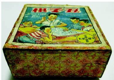
图4 “中国工艺社”牌玩具包装盒 Fig. 4 “Chinese Work Shop” toy packaging box

但厂商注册使用商标的目的,主要是区别产品的生产企业,如图4所示的“中国工艺社”牌玩具包装盒,右下角的商标就突出了企业名称。