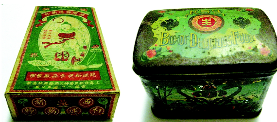
a) “哪吒”牌藕粉包装盒