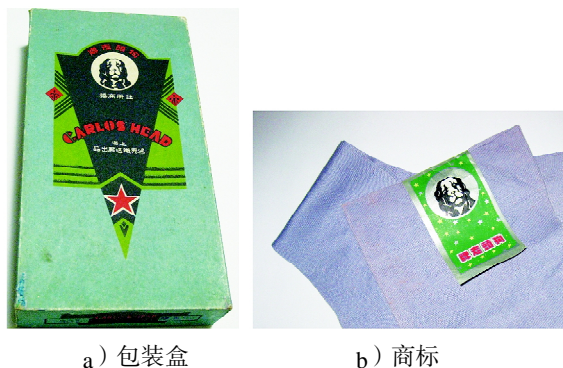
图6 “狗头”牌袜子产品包装与商标图样

装饰性图样,同时用红、绿、蓝、白和黑等数种颜色来美化包装盒(见图6)。此外,在包装盒的各侧面设计有文字,不仅作为一种装饰性的点缀,还起到广告说明的作用。该产品的标贴图样在色彩、图形等方面,则均比包装盒简单许多。