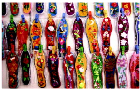
图1 湘西少数民族刺绣鞋垫

湘西原始手工艺术在社会变迁的历史长河中,代代相传并不断丰富创新。湘西手工刺绣鞋垫就是土家族和苗族的一种传统手工艺品,极富民族特色。湘西拥有独特的山水景观、迷离的人文环境与浓郁古朴的民族风情。由于地处亚热带季风湿润气候,雨水丰沛,光热量偏少,所以人们都有使用鞋垫的习惯。湘西少数民族的鞋垫不仅用以防潮和保暖,而且还担负着传播文化的功能,已然成为土家族、苗族人民风俗礼仪中必不可少的特色物品,常常被作为珍贵的礼物出现在婚嫁或迎送场面之中。在湘西地区,十几岁的土家族和苗族小姑娘就已经是刺绣能手了。她们还在年幼时就在长辈的言传和姊妹的熏染下学习各种针织手工技艺。一双手工刺绣鞋垫从底料浆洗到布面选样,从丝线配色到针脚走线,制作者对每一道工序都非常讲究,因为它们直接关系着鞋垫的质量。在湘西少数民族同胞的观念中,是否能缝制出一双结实而美观的鞋垫,成为了评价女人们是否聪明与勤劳的标准之一。同时,秀美结实的鞋垫也是土家族、苗族少女的传情之物,可谓“线线寄相思、针针传真情”。如果未婚男子看中了哪家姑娘,就会搭讪着探问是否可以送一双亲手纳制的刺绣鞋垫,倘若对方答应了,这门姻缘也就差不多了。图1为各种湘西少数民族刺绣鞋垫。