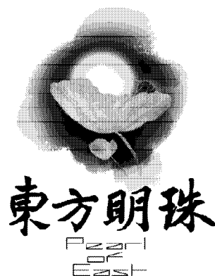
图5 “东方明珠” 楼盘标志 Fig. 5 “Oriental Pearl” estate symbol

在现代楼盘标志设计中,设计师应在对审美特性全面把握的基础上,对图形进行有目的、有倾向性地取舍和提炼,使虚实形态成为画面整体的有机构成因子,以提高标志的承载能力和信息的表达能力,使作品呈现出整体、和谐、统一的艺术效果。如杭州“东方明珠”楼盘标志设计(见图5),运用虚实形态相结合的表现形式,采用以墨代彩、水墨设色的设计手段,来表现作品的形体质感及阴阳背向,以达到“以形写神”“形神兼备”的艺术效果。