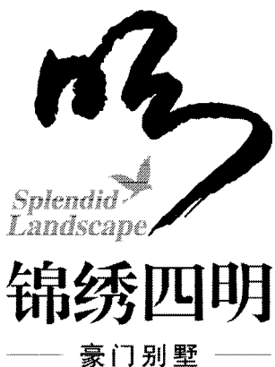
图2 “锦绣四明”楼盘标志 Fig. 2 “Splendid Landscape” estate symbol

分发挥中国书法的意象美、结构美,利用美术字及篆、隶、楷等字体,根据汉字结构进行加工变形等艺术处理。文字标志设计一定要注重字形的可辨性,并力求美观。如笔者设计的杭州“锦绣四明”楼盘标志(见图2),“明”字字型标志醒目而独特,充分体现了我国书法艺术的意象美和结构美。