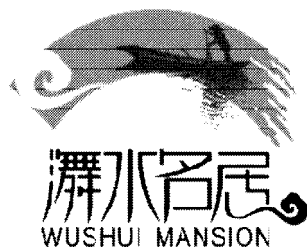
图3 “舞水名居” 楼盘标志

在设计时可采用夸张、象征、寓意和抽象等方法,以生动的造型构造独特的视觉语言,避免自然形态的简单再现。