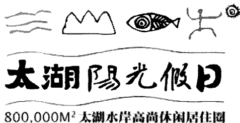
图6 “太湖阳光假日”楼盘标志 Fig. 6 “Sunshine Holiday Lake” estate symbol

象形文字以“像实物之形”的图形为文字,是中国古代使用图形符号来传达思想与沟通感情的一种手法随意的图画文字 [5] 。如“日”“月”“山”“水”等都是象形文字。在现代楼盘标志设计中运用象形文字是一种新的创意方法与探索。如图6所示的“太湖阳光假日”楼盘标志,即是运用象形文字创意方法设计的。