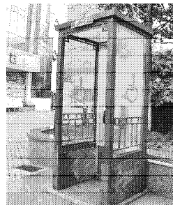
图 4 残疾人专用电话亭 Fig. 4 The special booth for handicapped people

木质户外家具本身是没有情感的, 只有当它与所面对的场所使用者的情感需求相适应时, 才表现出一定的情感性, 才真正体现出它的设计价值。