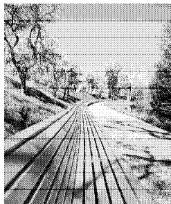
图 3 休闲长椅 Fig. 3 Leisure bench

含的某些信息在引起人的联想、共鸣和思考之后, 所产生的一种高级的、深层次的心理感受, 如温馨、甜蜜、感叹、崇敬等。反思情感也跟人的经历、文化背景有关, 使生活在场所中的人们产生归宿感、自豪感, 从而激发对场所与生活的热爱。