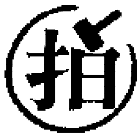
图2 “92国际拍卖会”标志 Fig.2 The “92 international auction” sign

3)图文解字:汉字是具有特定涵义和形态的文字图形,因此,在设计中可以借助汉字象形会意的方式来设计文字,以字示图,以图释字,从而准确地表达出事物本身的含义。如王国伦设计的“92国际拍卖会”标志 [13] (如图2所示)。