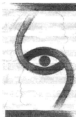
图1 互动招贴 Fig.1 Interactive poster

意产业包含创意、创作、创造三大要素 [3] 。辽宁师范大学赵迪老师给“创意产业”下了一个通俗的定义：“以创意为核心，向大众提供文化、艺术、精神、心理、娱乐产品的新兴产业。” [4] 其实创意产业的概念最早是在1998年由英国创意产业专责小组提出的，他们认为创意产业就是源于个人创造力与技能及才华，通过知识产权的生成和取用，具有创造财富并增加就业潜力的产业。他们列出了包括设计、广告、电影电视、音乐和出版等在内的13个子行业，可以说研究创意设计有着重要的意义。